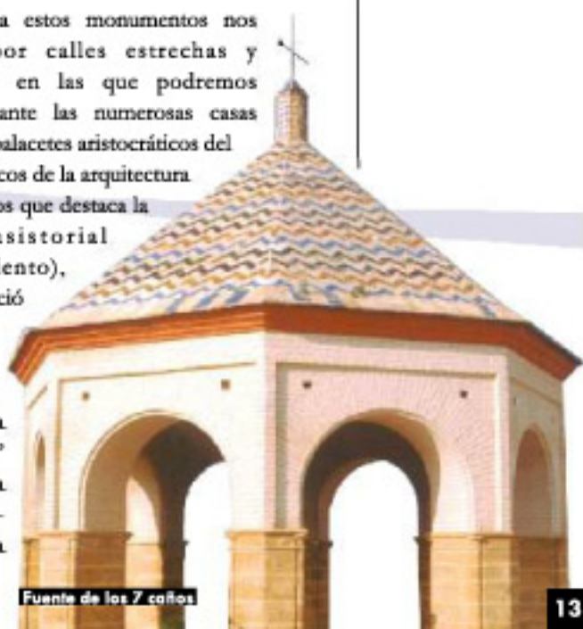
Fuente de los 7 caños