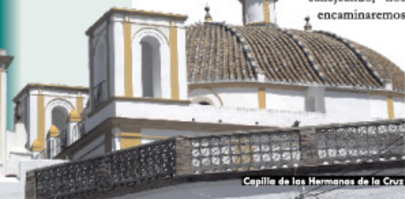
Capilla de las Hermanas de la Cruz

Arco "Niño Perdido" en la antigua judería, callejeando, nos encaminaremos