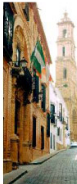
Casa de la Cultura con Santa María de la Mesa al fondo