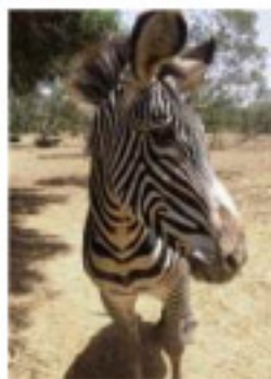
Reserva Animal del Trance de Aragón