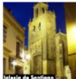
Iglesia de San Pedro