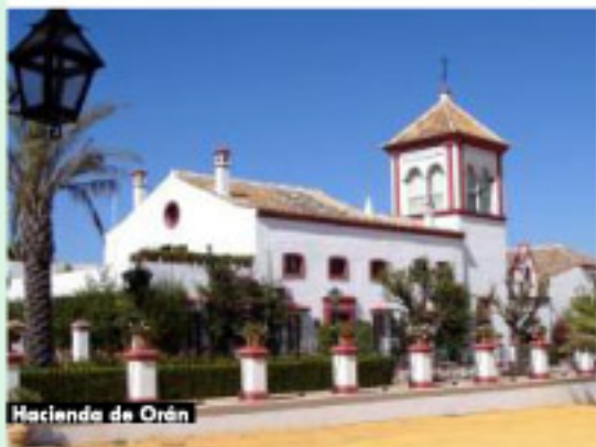
Hacienda de Orán