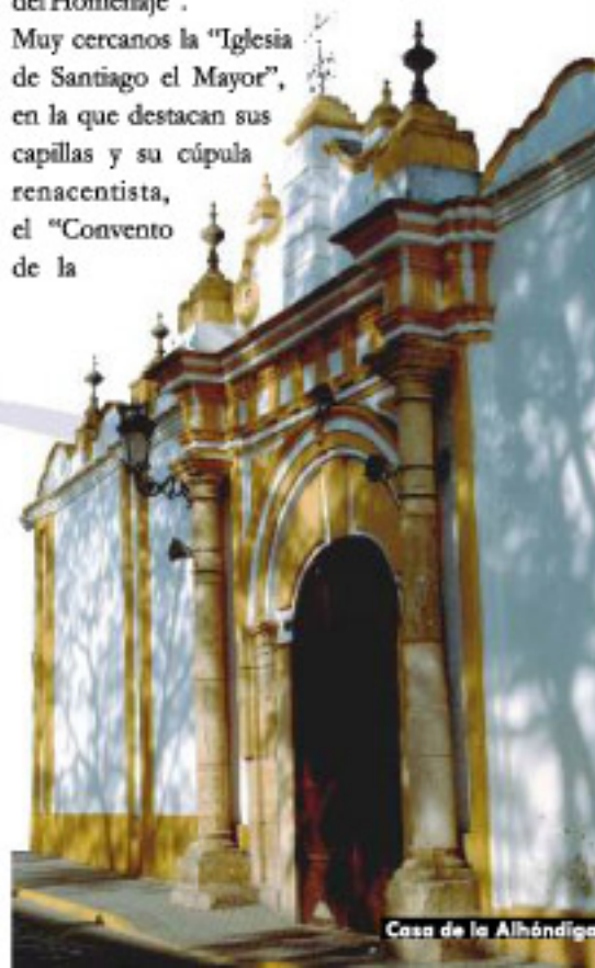
Casa de la Alhóndiga

Muy cercanos la "Iglesia de Santiago el Mayor", en la que destacan sus capillas y su cúpula renacentista, el "Convento de la