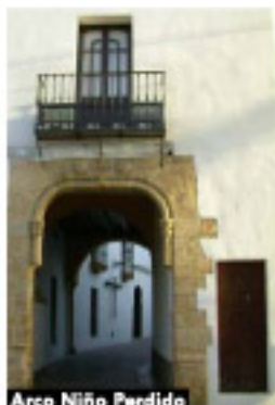
Arco Niño Perdido

El patrimonio religioso se completa con las capillas del "Carmen" y de "San Bartolomé", s. XVII, situadas prácticamente enfrente una de la otra, en la popular Avenida de San Juan Bosco. También cuentan con un importante patrimonio artístico