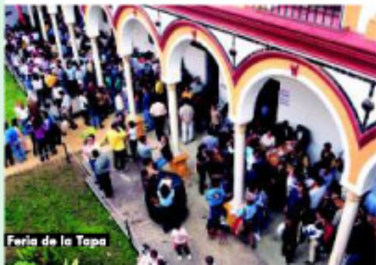
Feria de la Tapa

Entre los festejos más señeros de Utrera, la Feria en honor a su patrona, la Virgen de Consolación (8 de septiembre) representa la manifestación de alegría y diversión más popular en las calles y casetas del Real de la Feria. Igualmente son eventos de gran importancia la Semana Santa (marzo-abril), la romería de Nuestra Señora de Fátima (mayo), las Fiestas de San Juan (24 de junio) y "Potaje Gitano de Utrera" (junio), primer festival flamenco de España en el que se dan cita anualmente las grandes figuras del canto y el baile.