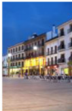
Plaza del Altozano

Otra aconsejable ruta en el entorno de Utrera nos conduciría al Pantano de Águila, muy cerca de la pedanía utrera de El Palmar de Troya, enclave ideal para la pesca y la práctica de deportes acuáticos. También muy próxima a El Palmar se encuentra el "Complejo Endorreico de Utrera", declarado Reserva Natural por la Junta de Andalucía y formado por las lagunas de "Alcaparrosa", "Arjona" y "Zarracatín", sobre terrenos arcillosos del cuaternario y con una vegetación característica de carrizos y juncos. En estas aguas se pueden divisar aves como el ánade rabudo, la aboceta, la cigüeñuela, el porro común, el ánade real o el correlimos, de paso migratorio hacia el continente africano.